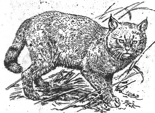
Рис. 17 Камышевый кот

Камышевый кот или камышевая рысь. Обитает в приречных кустарниках и камышах Сулака, Терека, Кумы, в низменном Дагестане, по всей низменной части В. Закавказья до Сурамского хребта на запад и по долине Аракса в Армении. Далее его ареал уходит в Среднюю и Южную