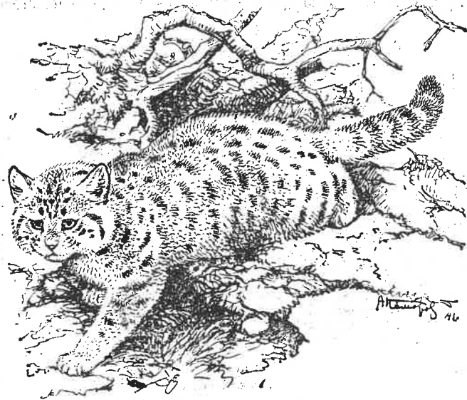
Рис. 16 Степной кот

Степной кот. Называется также пятнистой или хвос-