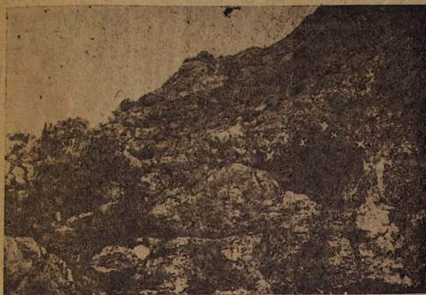
Рис. 1. Вход в пещеру Сулузага. Белыми крестиками обозначены слева направо: 1. гнездо синего каменного дрозда, 2. гнездо поползня, 3. гнездо горной ласточки, 4. гнездо каменного воробья.

В дуплах деревьев и среди площадок корней густых кустов можжевельника гнездятся совки ( Otus scops pulchellus ), на ветвях, по